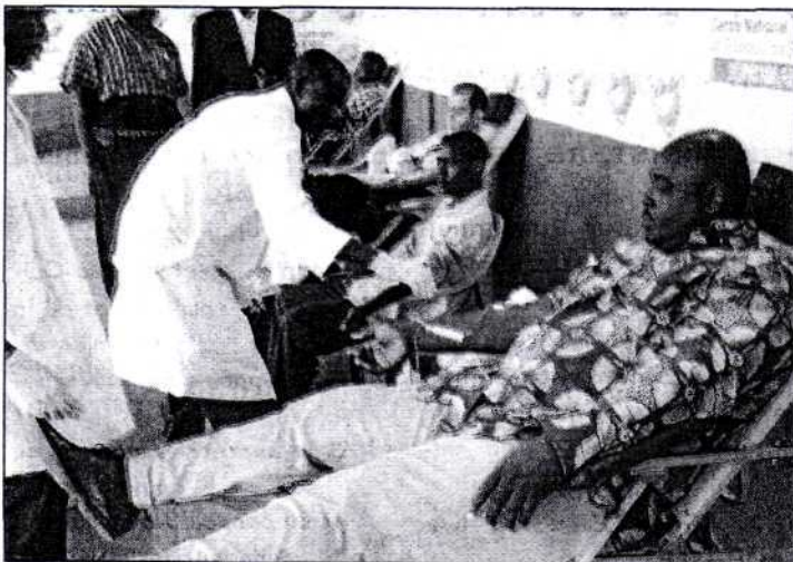
A l'image du chargé des relations publiques,